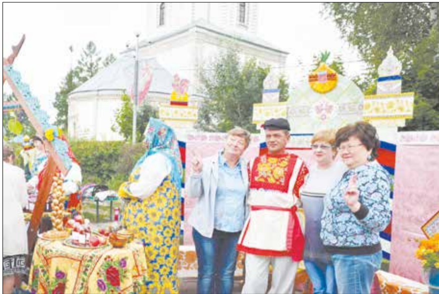
фестиваля — выставка-ярмарка народных художественных промыслов и одежды из льна с участием более 100 производителей. Количество участников около 2000 человек.