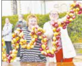
Фестиваль ежегодно посещают более 5000 человек.

23 сентября, Палехский район, п. Палех, центр около Крестовоздвиженского храма (ул. Ленина) Крестовоздвиженская ярмарка-фестиваль «Палех — город мастеров» проводится ежегодно в канун престольного праздника Воздвижение Креста Господня. История возникновения ярмарки уходит в 18 век. Главными действующими лицами на ярмарке являются палешане и жители Палехского района, а также к участию в ярмарке приглашаются представители Ивановской области и всех регионов России, на территории которых бытуют традиционные художественные промыслы, мастера-умельцы декоративно-прикладного и народного творчества, предприятия и организации, занимающиеся производством художественных предметов народного искусства, представители сельскохозяйственных предприятий и крестьянских подворий. Количество участников около 4000 человек.